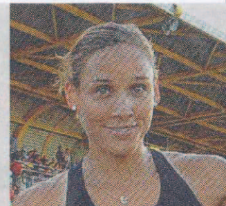
Il sorriso della stella Lolo Jones